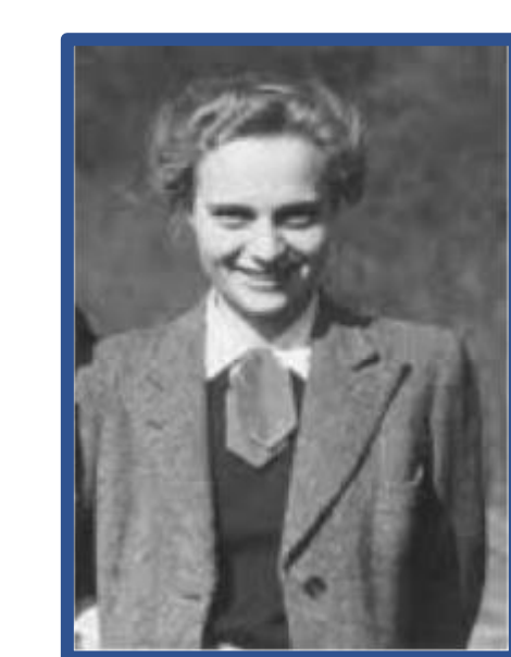
Margarethe beim Widerstand