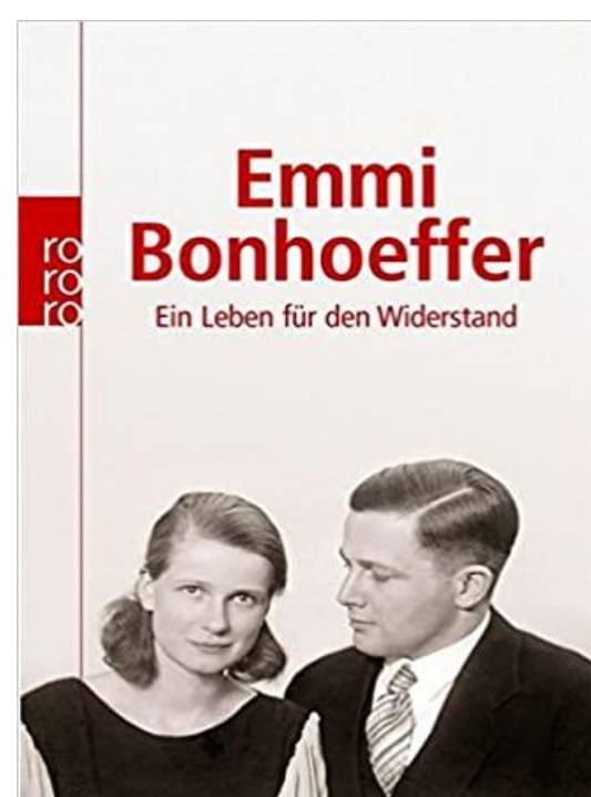
Biografie Emmi Bonhoeffer