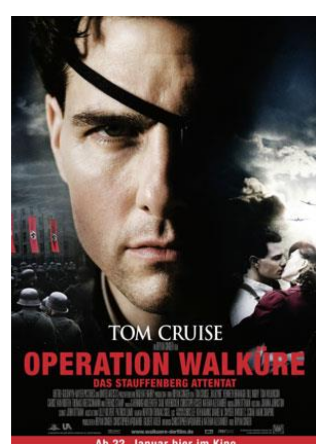
Hollywood Verfilmung „Operation Walküre“ (2008)